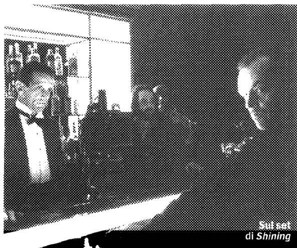
Sul set di Shining

CINEMA • LIBRI • MUSICA • TV • PER SEGNALAZIONI: CULTURA@INTERNAZIONALE.IT