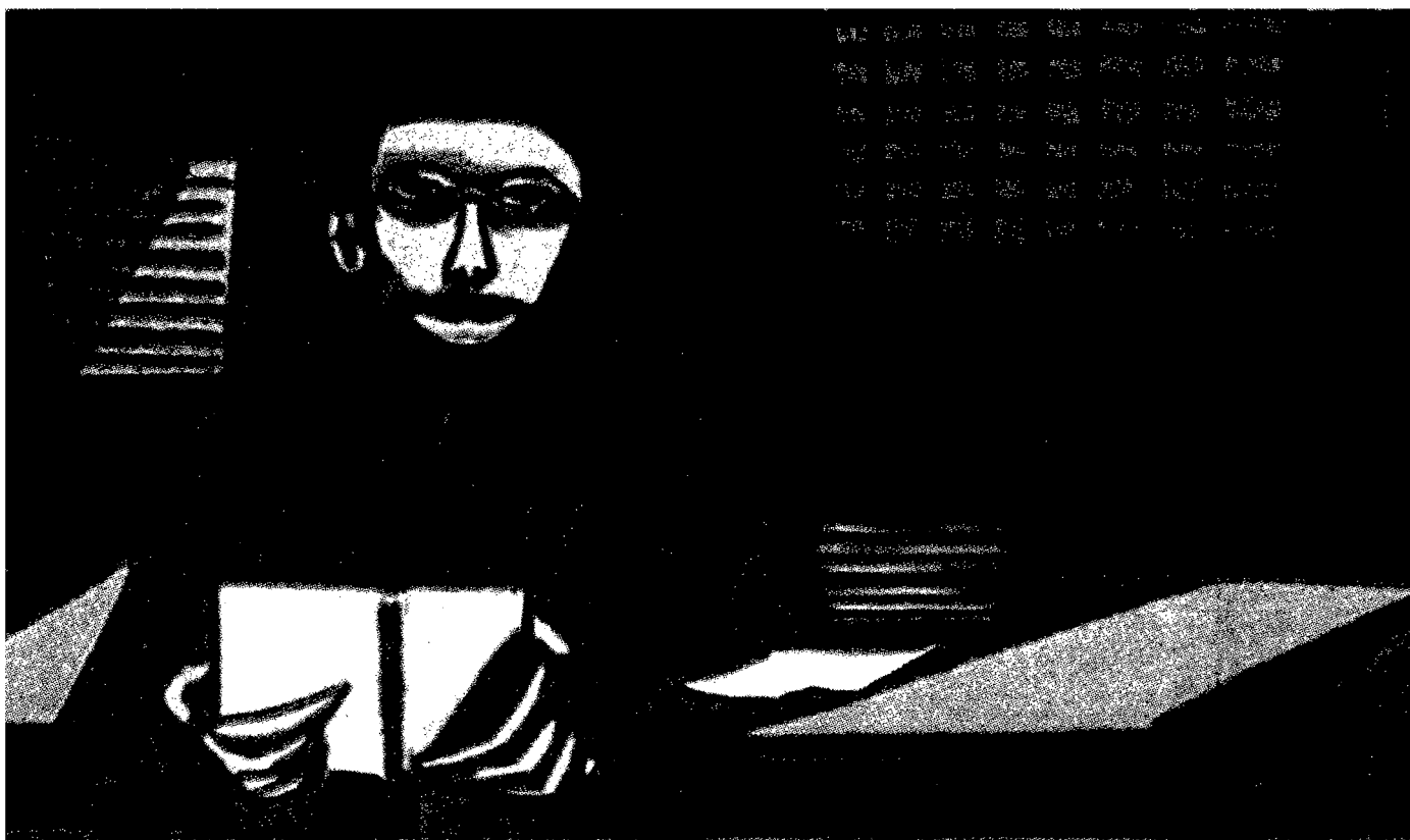
Antonio Gramsci in un ritratto di G. Viola . Le sue «Lettere dal carcere» uscirono nel 1947