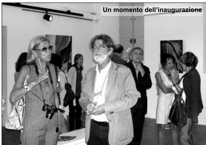
Un momento dell'inaugurazione