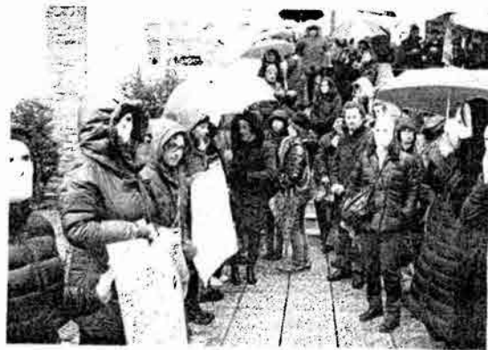
La protesta degli insegnanti precari della Pa

La stessa umiliazione di Lucia la provano i tanti giovani precari della Repubblica che negli ultimi giorni stanno puntando il dito verso la sentenza del Collegio dei Garanti contro il ricorso presentato dai partiti di opposizione, che ha definito legittimo il tanto discusso articolo 44 della Finanziaria del 20 dicembre 2013, a riaprire negli ultimi giorni una questione irrisolta. «Il Collegio dei Garanti — fanno sapere un gruppo di precari della Pa sammarinese — ha definito legittimo un provvedimento che definire vergognoso è un eufemismo. In un periodo in cui è evidente che il bilancio del nostro Stato è in sofferenza e quindi occorre trovare i soldi, il nostro Governo ha la bella idea di inasprire le imposte per i precari». Ad alzare la voce non sono soltanto i diretti interes-